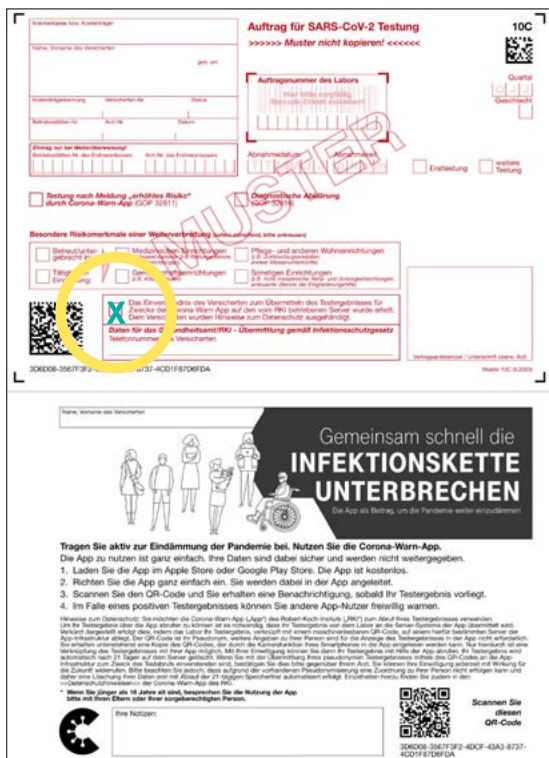
Abb. 1: Muster 10C-Schein (Teil A und Teil B)

Durch Ankreuzen „X“ wird das Einverständnis der Patienten zur Ergebniseinstellung in die CoronaWarn App dokumentiert. Ansonsten kann das Labor die Daten nicht in die CoronaWarn App übertragen.