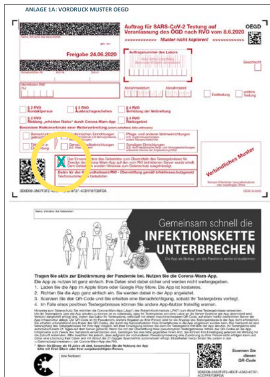
Abb. 2: Muster OEGD-Schein (Teil A und Teil B)