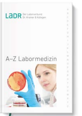
Unser Leistungsverzeichnis A-Z Labormedizin als Buch

Einen Überblick über das gesamte labormedizinische Analysespektrum des LADR Laborverbundes erhalten Sie mit unserem Leistungsverzeichnis A-Z Labormedizin . Ein unentbehrlicher Ratgeber, den Sie als Einsender kostenlos bestellen können: 0800 0850-113 . Wenn Sie online im Verzeichnis nachschlagen möchten: www.LADR.de/diagnostik/a-z-suche