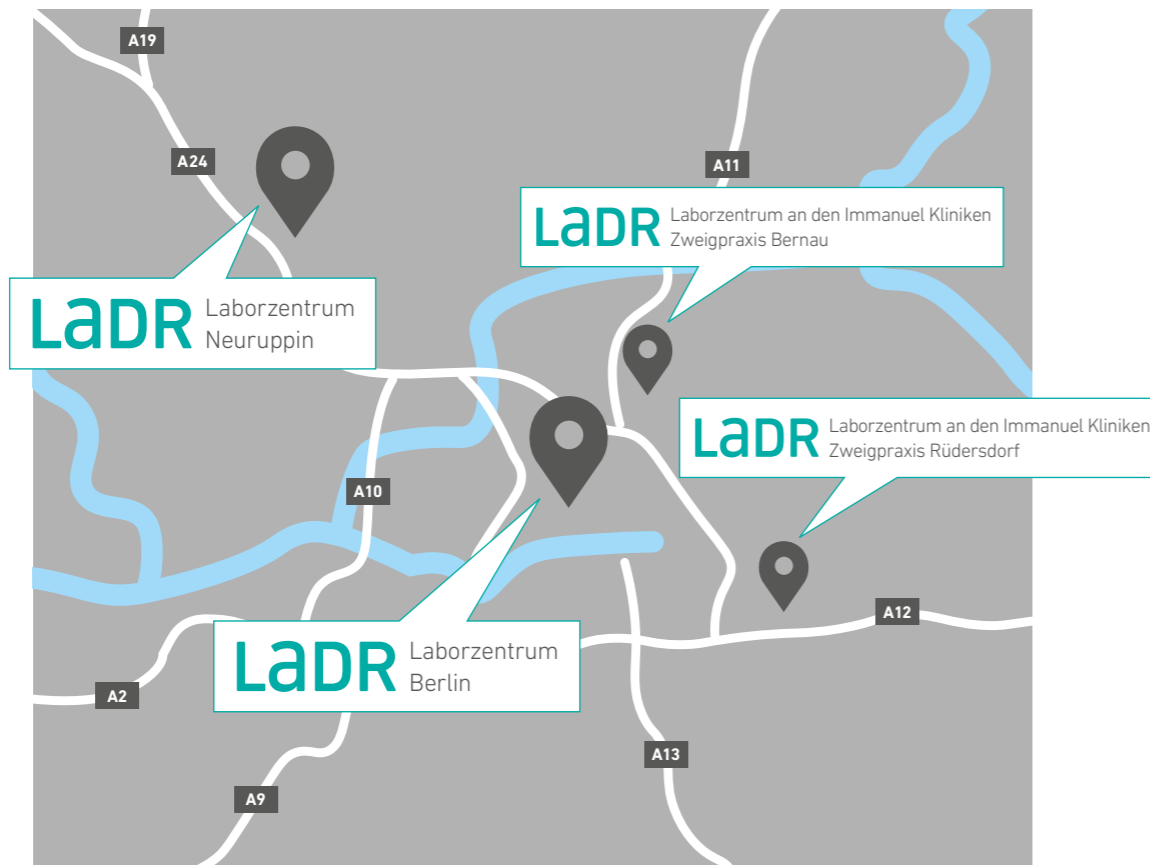
Kartendaten © 2019 GeoBasis-DE/BKG (© 2009), Google

unsere hohe Analysequalität und den umfassenden Service. Ob es um die Probenannahme, die Befundauskunft und -übermittlung oder diagnostische Fragen geht – wir setzen uns persönlich ein, finden Antworten und individuelle Lösungen.