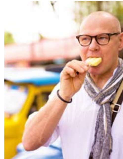
Besser nicht! Es ist ratsam, in tropischen und subtropischen Ländern auf Speiseeis zu verzichten.