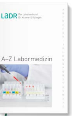
Unser Leistungsverzeichnis A-Z Labormedizin als Buch

Einen Überblick über das gesamte labormedizinische Analysespektrum des LADR Laborverbundes erhalten Sie mit unserem Leistungsverzeichnis A-Z Labormedizin . Ein unentbehrlicher Ratgeber, den Sie als Einsender kostenlos bestellen können: 0800 0850-113 . Wenn Sie online im Verzeichnis nachschlagen möchten: www.LADR.de/diagnostik/a-z-suche