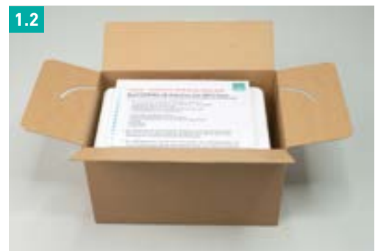
Abb. 1.2 Infoblatt und Begleitschein liegen griffbereit