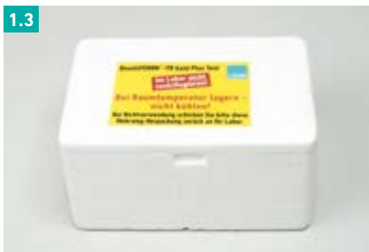
Abb. 1.3 Styroporbox für den temperierten Transport (wiederverwendbar)