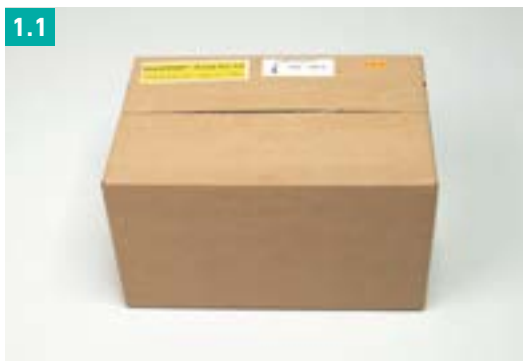
Abb. 1.1 Karton mit dem QuantiFERON® LADR Versand-Set (Best.-Nr. 110843)