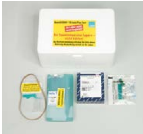
Abb. 4: Inhalt der Styroporbox bei Lieferung. Nicht abgebildet: Großer Klappenbeutel, Adressaufkleber, Adapter im Qiagen-Entnahmeset