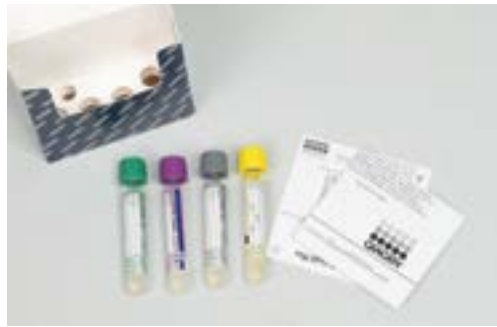
Abb. 3: Druckverschlussbeutel mit vier Blutröhrchen für eine sichere Zuordnung zum QuantiFERON®-TB Gold (QFT)-Test

Von entscheidender Bedeutung bei der funktionellen Untersuchung von Blutlymphozyten ist die Einhaltung eines bestimmten Temperaturbereichs nach der Blutentnahme. Im Gegensatz zu vielen anderen Materialien sind die nicht inkubierten Blutlymphozyten kälteempfindlich und sollten ungekühlt in unserer Versandbox (s. Abb. 1.3) transportiert werden.